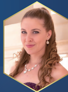
ハンナ・タカーチ (ソプラノ)