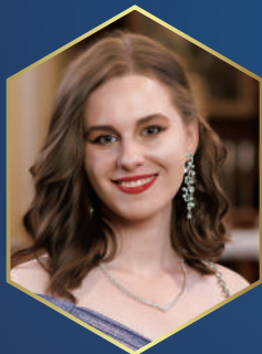
アンナ・ヴォレント (ソプラノ)

J.S.バッハ(グノー編曲)アヴェ・マリア シューベルト:アヴェ・マリア カッチーニ:アヴェ・マリア J.S.バッハ:G線上のアリア ヴィヴァルディ:「四季」より“冬” パッヘルベル:カノンとジグ マスネ:タイスの瞑想曲 ほか