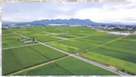
過去の遺産は将来の実りをもたらす種である

上映後援団体：群馬県 / 前橋市 / 高崎市 / 群馬県教育振興会 / 上毛新聞社 / 朝日新聞社前橋支局 / 毎日新聞前橋支局 / 読売新聞前橋支局 / 産経新聞前橋支局 / 東京新聞前橋支局 / NHK前橋放送局 / エフエム群馬 / 群馬テレビ 協賛：群馬トヨペット株式会社 / 朝日印刷工業株式会社 / イオンモール高崎 / 石井明税理士事務所 / 特定医療法人 群馬会 / 株式会社 坂本商事 / ネット3月群馬株式会社 / 弁護士法人 龍馬 / 赤城グリーン株式会社 / 株式会社 エルマ / 株式会社 金井新聞社 / 株式会社 環境浄化研究所 / 有限会社 群馬共同映画社 / 群馬コープ観光株式会社 / 株式会社 群馬製菓 / 税理士法人 合同会計 / 株式会社 国府テクノ / 学校法人 国分寺学園 / 株式会社 坂本工業 / 医療法人社団 三愛会 / JA東日本くみあい飼料株式会社 / 株式会社 しみづ農園 / 株式会社 スポーツプロジェクト / 社会福祉法人 清光会 / 宗教法人 石上寺 / 高崎高校82期同窓生・FFC一岡 / 有限会社 織地所 / 中央群馬ホーム株式会社 / 有限会社 中央住宅販売 / 群馬県 山形公園 / 東洋ロザイ株式会社 / 株式会社 中野商事 / 株式会社 ニチマイ / ヒア/プラザ群馬 / 福田モーターズ / 株式会社 プリエッセ / 株式会社 丸島 / 三原コンクリート工業株式会社 / 群馬くみあい運輸株式会社 / 株式会社 コイケ / 上毛製菓株式会社 / 中久田送株式会社 / 株式会社 協和 / 鳳王精製 / 有限会社 高橋製作所 / 有限会社 寺口堂 / 宗教法人 天晴寺 / 宗教法人 徳昌寺 / 株式会社 モダンアート / 株式会社 モリシタ電気 / 山口きもの学院 / 株式会社 伊藤 / 丸屋食堂 / 株式会社 関東甲信越ホクダ 群馬西部営業所 / 有限会社 クサノ・メディア / 群馬町自衛隊協会 / 有限会社 宏和 / 三誠商事 / しのめ信用金庫 群馬町支店 / 株式会社 ジャクエツ 前橋店 / 食手つかさ / 株式会社 石原中里 / 宗教法人 大乗寺 / 高崎市群馬商工会 / 長沼石材店 / 野村コンクリート株式会社 / 原嶋屋本家 / 株式会社 フジ電機 / 株式会社 ミナミジュエル 製作協力：「陸軍前橋（現ヶ岡）飛行場」製作協力委員会 企画・製作：アムール 配給：群馬共同映画社